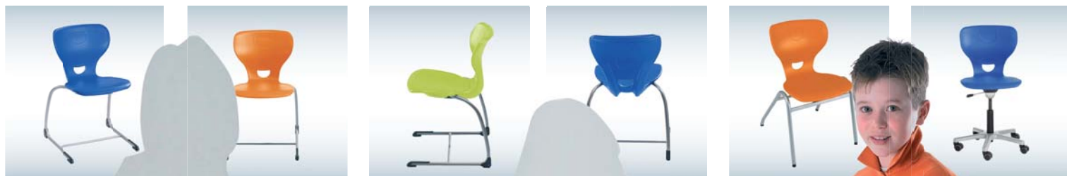
De Sediamo is leverbaar met verschillende frametypen