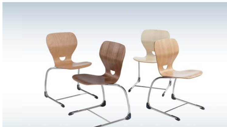
De Sediamo is leverbaar in verschillende houtsoorten