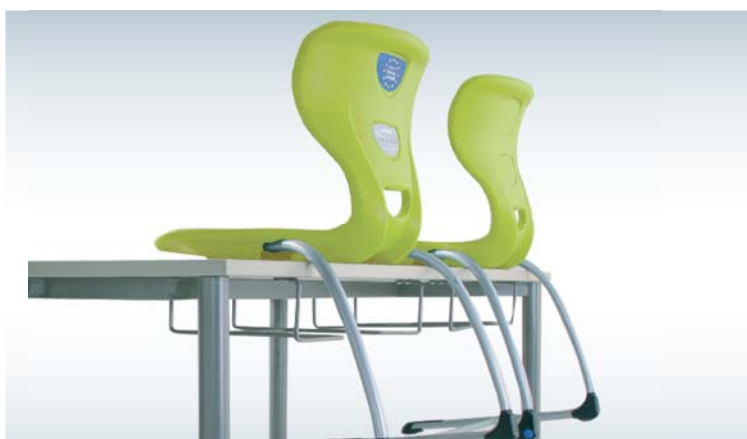
De Sediamo Swing is eenvoudig op de tafel te plaatsen zonder deze te beschadigen